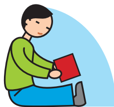
Manque de jeux imaginatifs