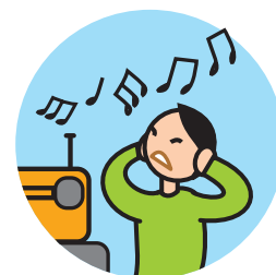
Peut être hypersensible aux sons, aux odeurs ...